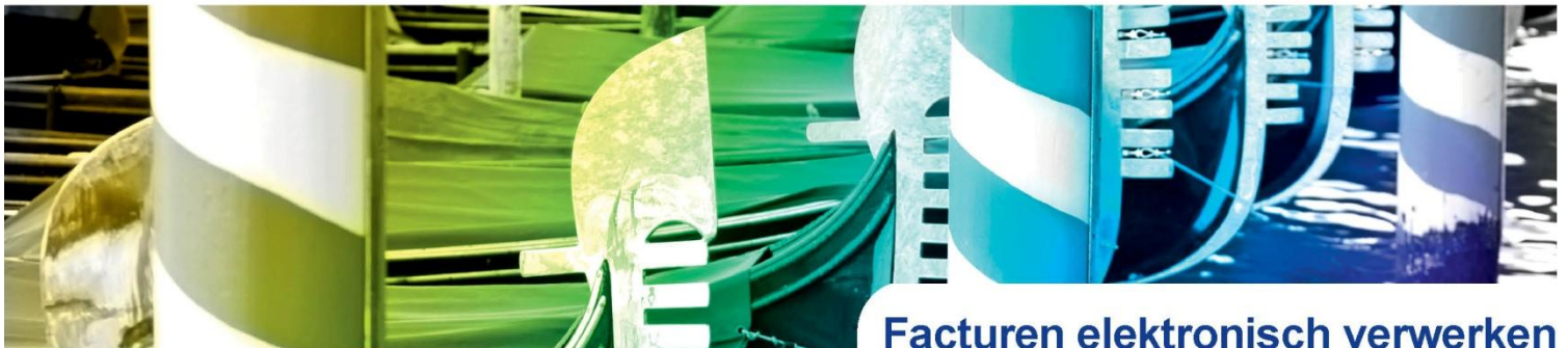
Facturen elektronisch verwerken